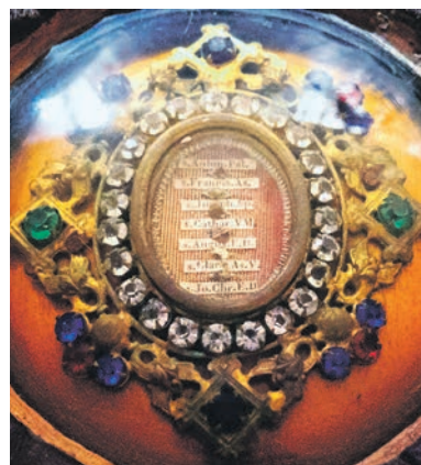
Bažnyčios pagrindiniame altoriuje esantis relikvijorius. Fot. Antano Blužo OFM, 2016 m.