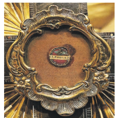
Šv. Pranciškaus relikvija. Fot. Gedimino Numgaudžio OFM, 2016 m.

Prieš 10 metų šis relikvijorius iš kolonos išimtas ir įmontuotas naujame centriniame balto marmuro altoriuje. Šiame relikvijoriuje yra šv. Antano Paduviečio, šv. Juozapo, šv. Pranciškaus Asyžiečio, šv. kankinės Kotrynos, šv. Bažnyčios daktaro Augustino, šv.