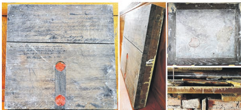
Švč. Mergelės Marijos altoriaus portatilis.

Pirmasis apie tai, kad 1827 m. liepos 5 d. šviesiausias garbiausias ponas kunigaikštis Simonas Mykolas Giedraitis, Adramiteno vyskupas, Žemaičių vyskupijos sufraganas, šv. Stanislovo ordino kavaliereus, šį nešiojamą altorių pašventino ir jame esančias šv. Klemenso kankinio relikvijas suskaičiavo. Tam patvirtinti pasirašyta Varniuose pirmiau nurodytą