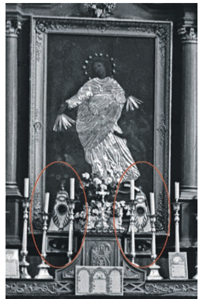
Šv. Mergelės Marijos altoriaus relikvijoriai tarpukariu.

Kriptos lubose žvakėmis išdegti kryžiai – nežinia, ar palikti