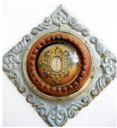
Ant bažnyčios kolonos buvęs relikvijorius. Šiuo metu jis yra bažnyčios pagrindiniame altoriuje. Fot. Jolantos Klietkutės, 2003 m.