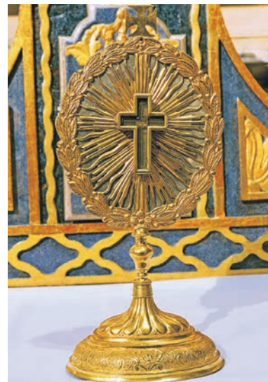
Šv. Antano relikvijorius. Fot. Gedimino Numgaudžio, 2016 m.

XIX a. Kretingos bažnyčios vizitacijos aktuose sakoma, kad šventųjų relikvijos yra visuose bažnyčios altoriuose, o centrinio altoriaus mūrinėje mensoje jos buvo įmūrytos prieš pašventinimą