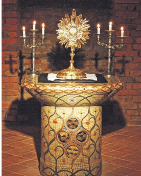
Kankinių kriptos altorius.

Pradžioje altoriai buvo statomi tiesiog ant kapų, vėliau šven-