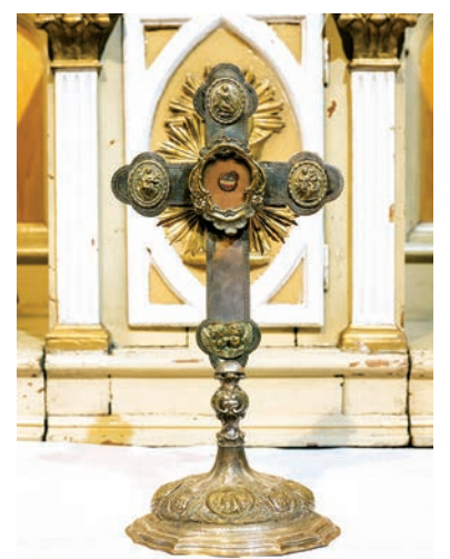
Šv. Pranciškaus relikvijorius. Fot. Gedimino Numgaudžio OFM, 2016 m.