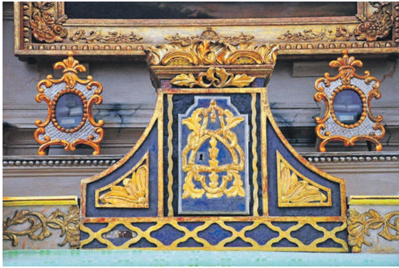
Šv. Antano altoriaus relikvijoriai.

Šv. Pranciškaus altoriuje sidabriniame ir auksuotame relikvijoriuje yra iš Romos parvežta šv. Pranciškaus Asyžiečio relikvija, kurią 1862 m. spalio 19 d. vyskupas M. Valančius paženklino savo antspaudu ir leido išstatyti viešai pagarbinti ketvirtadieniais bei Viešpaties dienomis ir suteikė keturiasdešimt dienų atlaidus dievobaimingai tą relikviją bučiuojantiems.