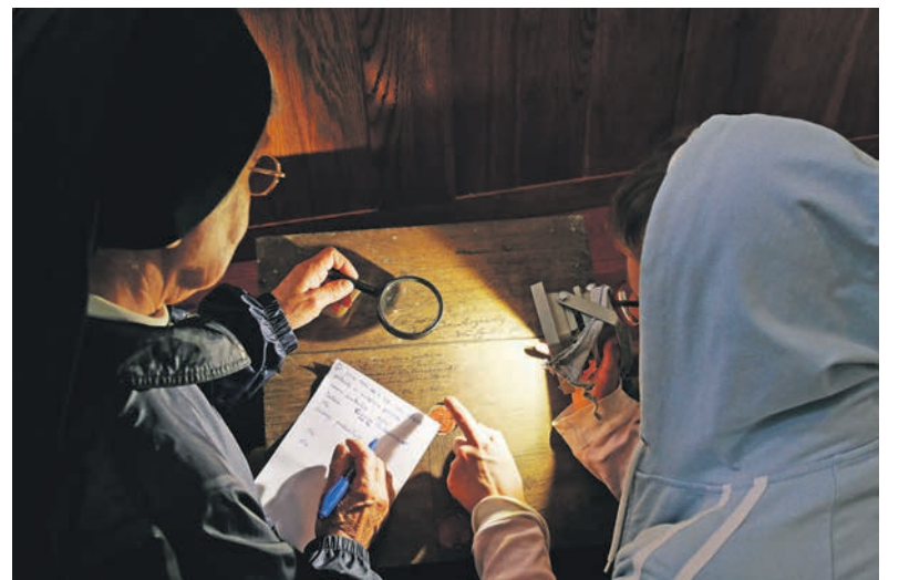
Širfuojamas Švč. Mergelės Marijos altoriaus portatilio užrašas. Fot. Jolantos Klietkutės, 2017 m.