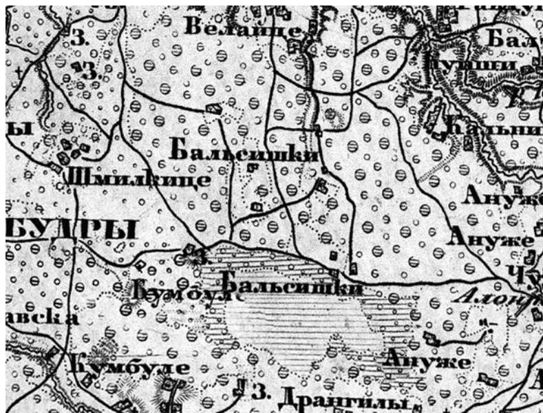
Balsiškių (Бальшички) 1868 m. planas. Ištrauka iš Rusijos imperijos generalinio štabo karininkų 1868–1900 m. parengto Kretingos apylinkių žemėlapiu.

Tą dieną MGB vidaus kariuomenės 24-ojo šaulių pulko kareiviai bei iš Kartenos, Skuodo, Salantų, Darbėnų ir Kretingos atvykę sribai Mikoliškių, Zutaūtų, Bumbulių, Balsiškių ir