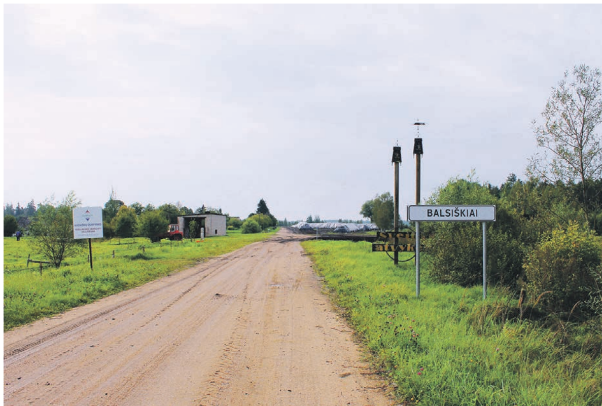
Balsiškių kaimo gatvė.