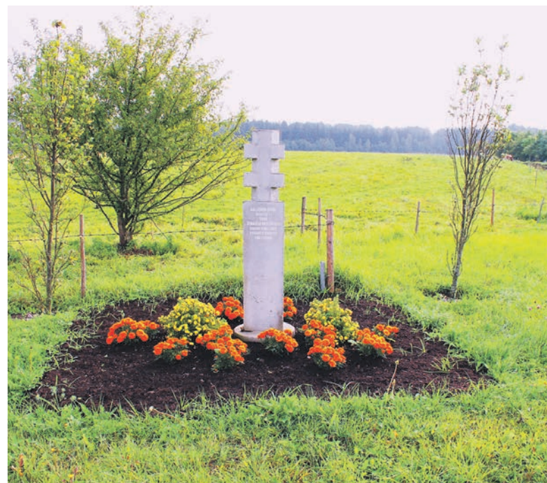
Tipinis atminimo ženklas 1948 m. rugpjūčio 11 d. Balsiškių kaime prie Tyro ir Pilalės žuvusiems Žemaičių apygardos Kardo rinktinės Buganto ir Skirmanto kuopų partizanams atminti. Autorius – dizaineris Romas Navickas, Vilnius. Pastatytas 2013 m., pašventintas 2014 m. Juliaus Kanarsko nuotr., 2014 m.