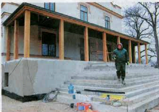
Kol neužklupo šalčiai, statybos darbai nesustoja.

Kodėl Kretingos dvaro šeimininkams reikėjo tokios verandos? Gal tai buvo grajų Tiškevičių užgaida?