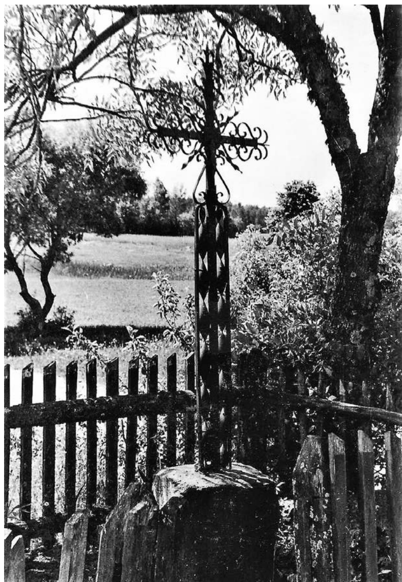
Kaltinis kryžius, pastatytas 1901 m. Fot. Juozas Mickevičius, 1960 m. © Kretingos muziejus, IF-3623.