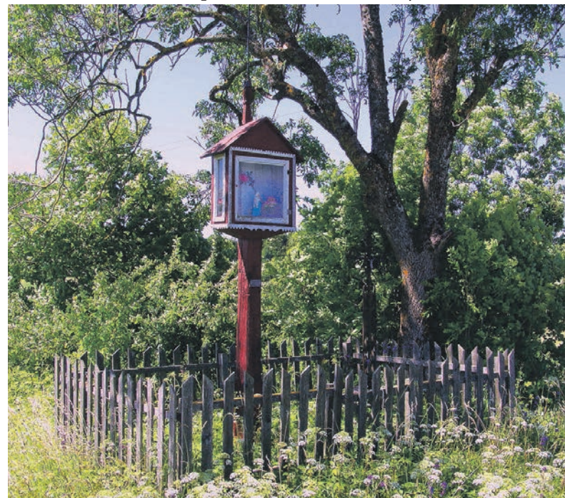
Koplytstulpis ir kryžius senojoje kaimo kryžkelėje.

Viduje skersai pastato buvęs plūkto molio laitas, skirtas spragilais kuliamiems javams pakloti, kurį apšvietė iš lauko pro atviras duris ir pastato galinėje sienoje iškirstą langą krentanti šviesa. Į dešinę nuo įvažiavimo ir laito pastato gale buvusi atitverta atskira, 5,2x6,5 metro dydžio patalpa su moli- ne krosnimi javams džiovinti.