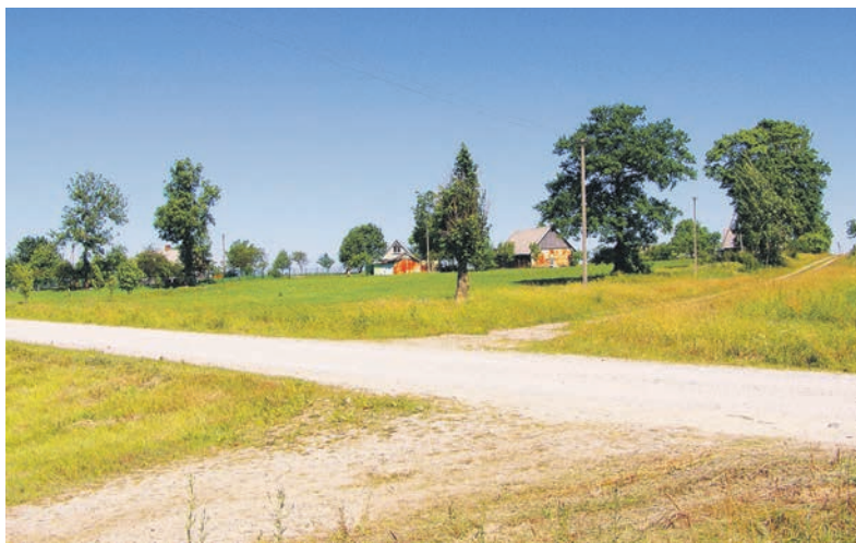
Senoji kaimo kryžkelė.