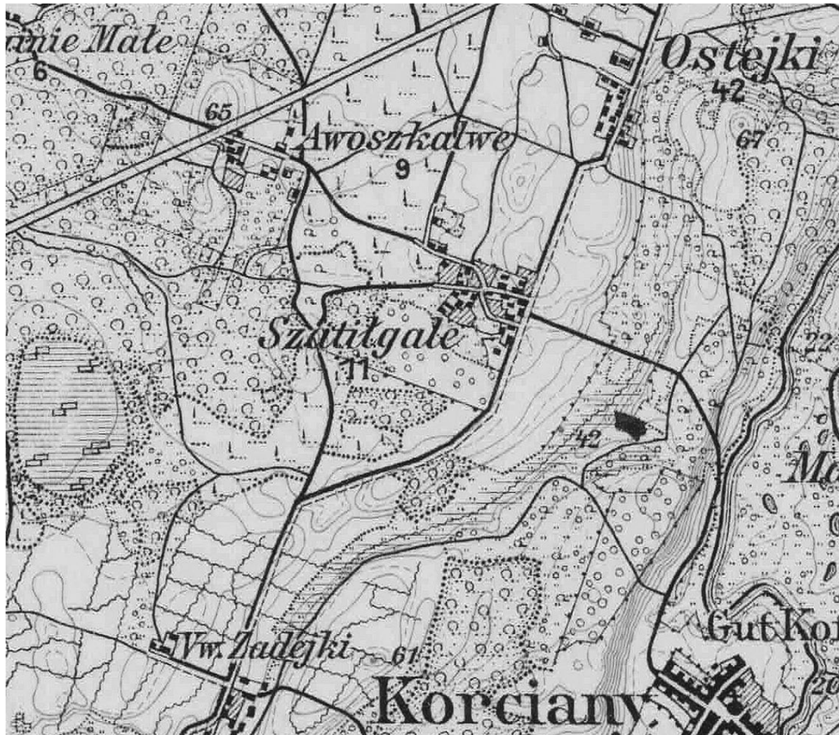
Šatilgalio kaimo planas. Ištrauka iš Prūsijos karinių kartografų parengto Kartenos apylinkių žemėlapiu. 1916 m.

Augant žemės ūkio produkcijos poreikiui, dvaro skatinami valstiečiai ėmėsi įdirbti plėšimus – ganyklas ir iškirstų miškų žemę. Taip XIX a. pirmoje pusėje Asteikių pietinėje dalyje, tarp valakais išmatuotų dirbamos žemės sklypų ir