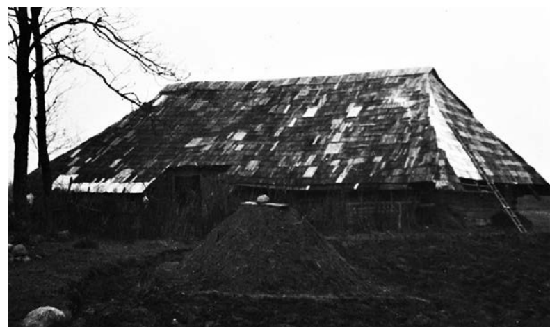
Prano Siurblio kluono nuotrauka. 1968 m.