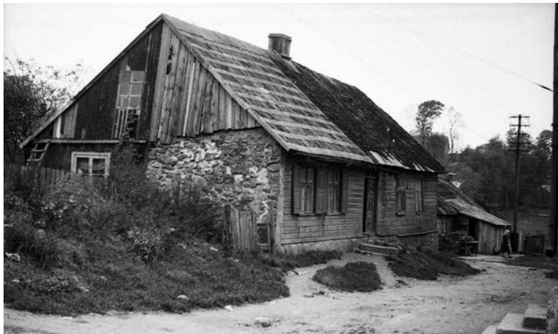
XIX a. statytas ir 1963 m. nugriautas namas Birutės g. 8, stovėjęs priešais mūrinį namą Akmenės g. 1. Fot. Juozas Mickevičius, 1962 m. © Kretingos muziejus, KM-IF125.

Greta vandens malūno grafas Aleksandras Tškevičius XX a. pradžioje atidarė vieną pirmųjų mieste lėntpjūvių, kurios įrenginius suko malūno turbinos. Joje rąstai pjovimo staklėmis buvo pjaunami į lentas, tašus ir ruošinius statybai. Malūną su lėntpjūve iš dvaro tarpukariu