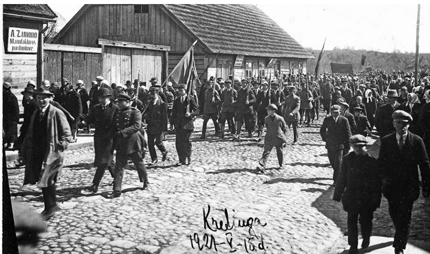
Kairėje – A. Zimono manufaktūros prekių parduotuvės sąskaita už žadeikių dvarui išduotas prekes. 1922 m. kovo 6 d. Dešinėje – šventinė eiseną Palangos (dab. Birutės) gatvėje šalia A. Zimono ir K. Markaus parduotuvių. Fot. Alfonsas Survila, 1927 m. gegužės 15 d. © Kretingos muziejus, Mokslinio archyvo Tiškevičių fondas; KM-IF8644.

Lit. Krottingen, Polangenstr. 14 קרעטינגען