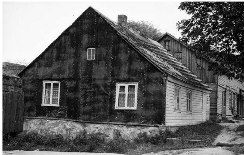
Dešinėje gatvės pusėje stovėję XX a. pr. statyti namai Akmenės g. 2 (pir-mame plane) ir Birutės g. 6, nugriauti 1963 m. Jų vietoje pastatytas ketu-raukštis silikatinių plytų daugiabutis namas. Fot. Juozas Mickevičius, 1962 m. © Kretingos muziejus, KM-IF117.

Žydų miestelio bendruomenė 1765 m. sudarė 92 žmonės, (Nukelta į 5 p.)