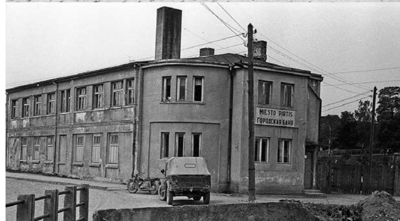
Viršuje – statomas L. Ramanausko namas, kuriame 1939 m. atidaryta A. Novickio kolonialinių prekių ir tabako parduotuvė. Fot. Stasys Vaitkevičius, 1939 m. Apačioje – 1941 m. atidarytos miesto viešosios pirties pastatas. Fot. Juozas Mickevičius, 1965 m. © Kretingos muziejus, KM-IF105, KM-IF129.

gatvės stovėjusio namo, kurio sklype XX a. 8 dešimtmetyje buvo pastatytas Kretingos rajono kolektyvinių sodų bendrijos administracinis-komercinis pastatas.