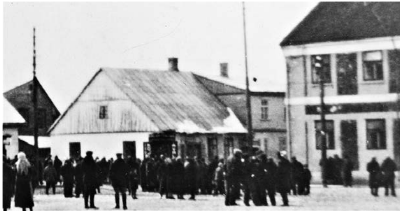
Viduryje – Mėguvos ir Birutės gatvių kampe stovėjęs namas, sudegęs 1941 m. birželio 26 d. Nežinomas fotografas, 1939 m. kovo 23 d. © Kretingos muziejaus mokslinis archyvas.

bendruomenės daliai įsikurus prie miesto turgavietės ir pagrindinių gatvių, o žydų dvasiiniu-religiniu centru tapus Mėguvos gatvei, Žydų Naujamiestis XIX a. pirmoje pusėje prarado turėtą svarbą. Jis tapo neatsiejama miesto dalimi ir buvo prijungtas prie Vokiečių gatvės, kuri tuo metu pavadinta Palangos gatve (rus. Полангенская улица).