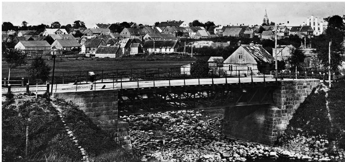
1828 m. pastatytas ir 1924 m. atnaujintas tiltas per Akmenos upę. Už jo – centrinė Birutės gatvės dalis. Nežinomas fotografas. XX a. 4 deš. © Kretingos muziejus, KM-IF70.