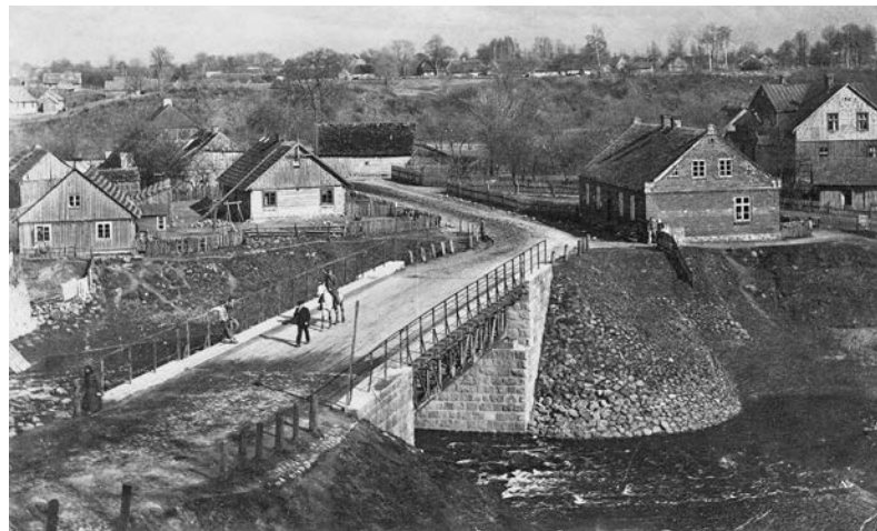
Buvusio Žydų Naujamiesčio vaizdas nuo Pelėdos kalno (Klaipėdos gatvės). Per tiltą raitas policininkas iš miesto į Kretingos (Bajorų) sunkiujų darbų kalėjimą lydi pėsčiomis varomą nuteistąjį. Juos stebi du klumpėmis avintys paaugliai, nugaromis atsiremę į turėklą. Už tilto dešinėje pusėje – mūrinis Varkojų namas, prie kurio stoviniuoja vyras su moterimi, akimis palydintys konvojų. Už namo matosi nedidelis skveras, apimantis dalį buvusios turgavietės, bei dešinėje pusėje stovintis namas Birutės g. 21 su dviem verandomis, mansarda ir mezoninu. Nežinomas fotografas. XX a. 3–4 deš. © Olgos Ganočkaitės archyvas (pateikė Lina Bruzdeilynienė).