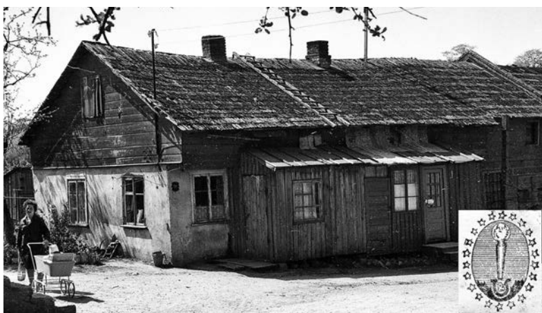
Eniko Šero žvakių fabriko „Švyturys“ pastatas Birutės g. 16. Fot. Steponas Kaštaunas, 1970 m. Apatiniame dešiniajame kampe – fabriko logotipas. © Kretingos muziejaus mokslinis archyvas.