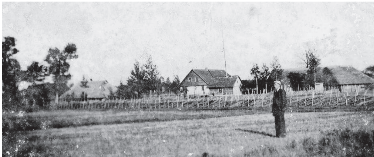
Kontrimų sodyba Kumpikų (Knėžų) kaime. XX a. 5 deš. pr.

Ši Kumpikų žemių dalis kelis kartus keitė savo priklausomybę. Nuo kaimo atsiradimo čia buvo Kumpikų bendrųjų ganyklų ir miško žemė. Valstiečiams ėmus dirbti plėšininę žemę, joje atsirado kelių vienkiamų kaimas, vadintas Kumpikų Medsėdžiais. Pobaudžiavinės reformos metu šiaurinė jo dalis su Kontrimų sodyba buvo priskirta Smeltės kaimui, o pietinė – pavadinta Knėžais. Po Lietuvos žemės reformos Kontrimų žemė atsidūrė dviejų kaimų teritorijoje: sodyba priklausė Knėžų, o už Grūšlaukės–Vaineikių kelio buvęs vaka-