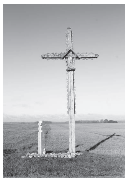
1989 m. pastatytas naujas kryžius ir 2018 m. statytas tipinis atminimo ženklas, žymintys Kardo rinktinės partizanų, jų ryšininkų ir rėmėjų Kontrimų sodybą. 2018 m.