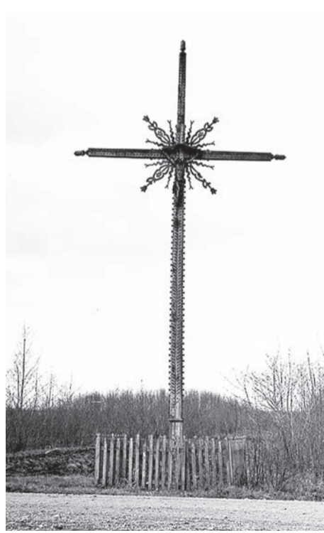
1947 m. statytas kryžius, žymintis Kontrimų sodybvietę. Fot. Steponas Kaštaunas, 1967 m. Iš Kretingos muziejaus rinkinio.