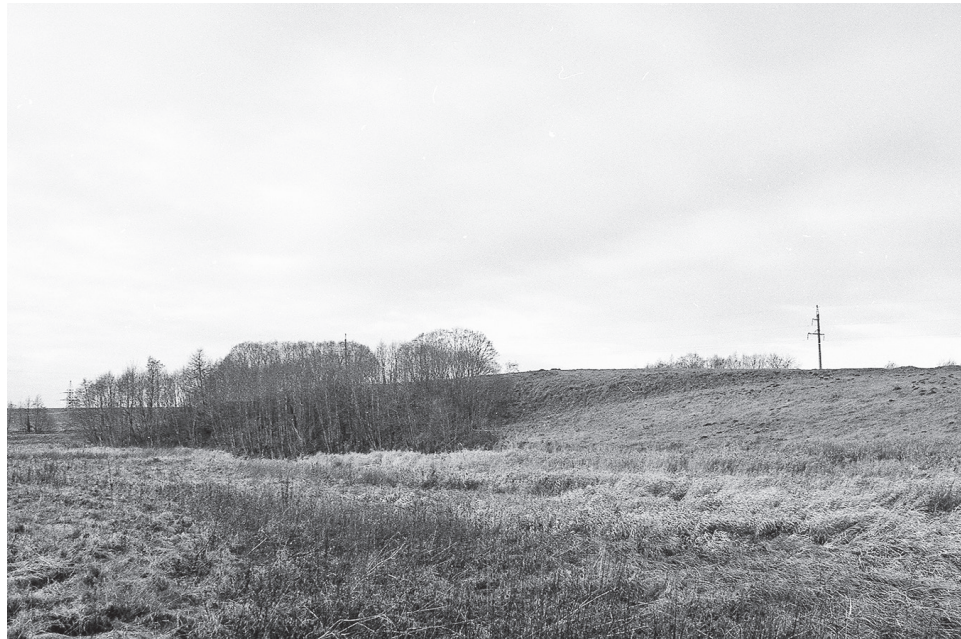
Piliakalnis iš pietryčių pusės.