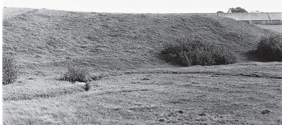
Piliakalnis iš vakarų pusės.

Tuo tarpu ant Marijos kalnelio stovėjusi pilaitė buvusi pagalbinė, naudota kaip pagrindinės (Nukelta į 6 p.)