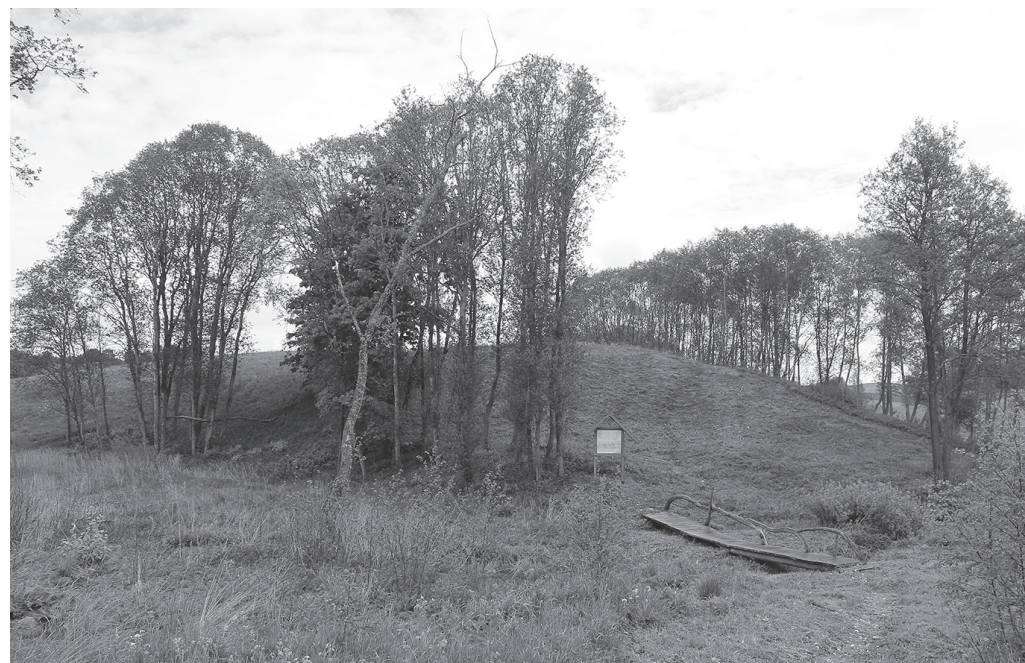
Piliakalnis iš pietvakarių pusės.