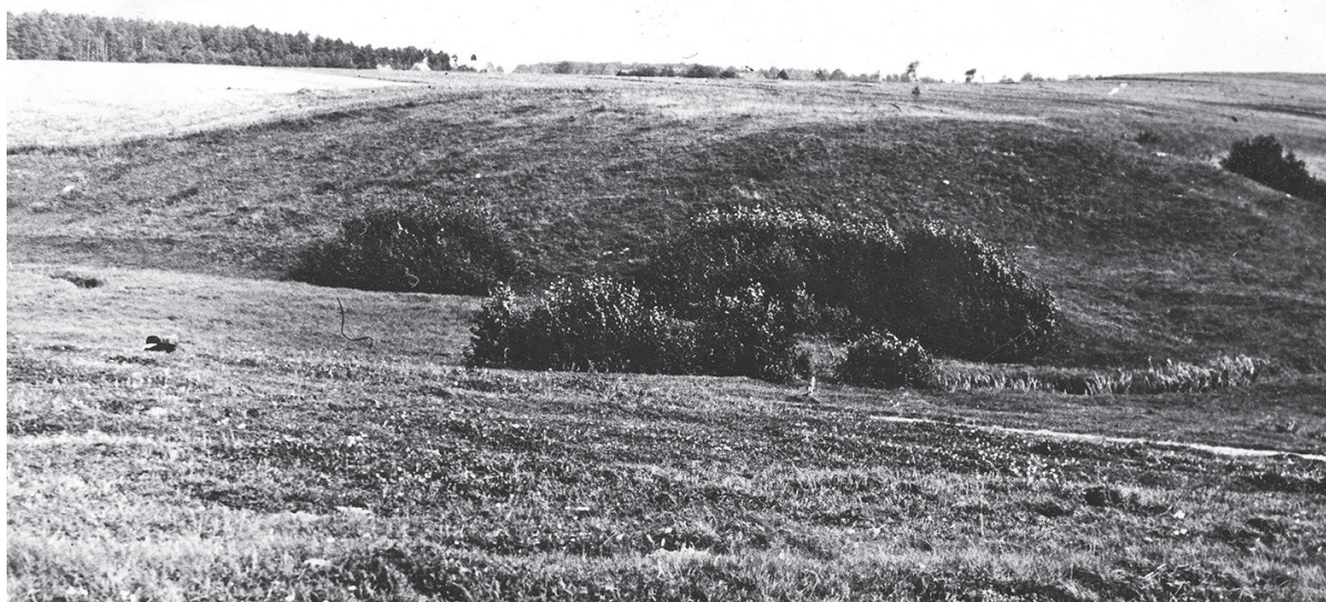
Piliakalnis iš pietvakarių-pietų pusės.

Nuo XVI amžiaus piliakalnis buvęs nuolat ariamas, todėl jo gynybiniai įtvirtinimai šiuo metu sunkiai išsiskiria iš aplinkos. Matyt todėl, skirtingai nuo kitų Senosios Įpilties piliakalnių – Pilies kalno ir Karo kalno, senovės paminklų tyrinėtojų dėmesio jis susilaukė gan vėlai. Jei pirmieji du piliakalniai archeologinėje literatūroje minimi nuo 1899 metų, tai Pilalė-Marijos kalneliu pirmasis 1960 metais susidomėjo Kretingos kraštoty-