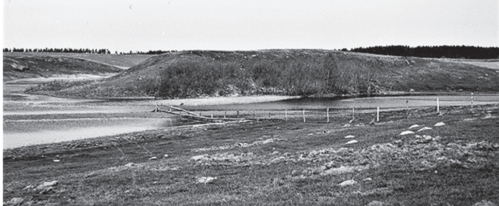
Piliakalnis iš pietryčių pusės. Adolfo Tautavičiaus nuotr., 1963 m. Lietuvos istorijos instituto rankraštynas, neg. 14041.