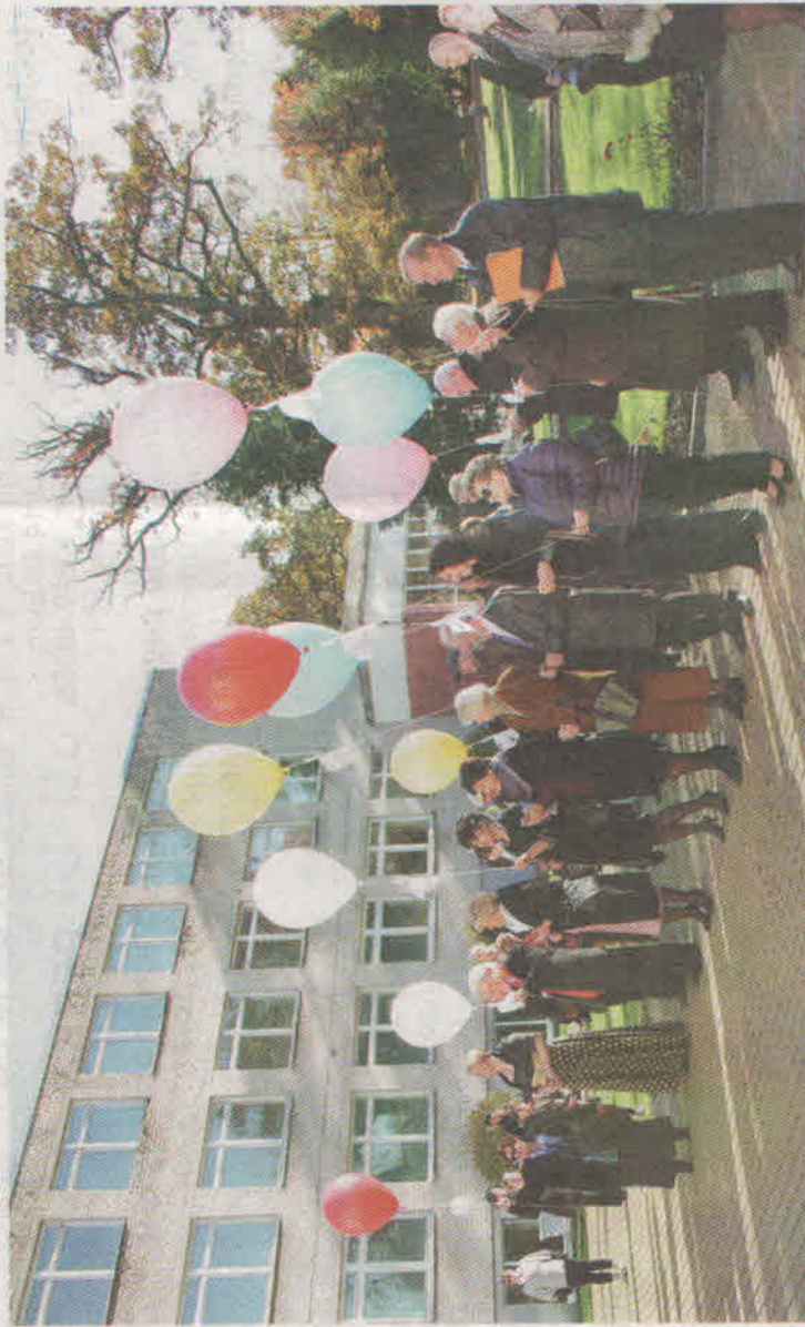
Į dangų paleisti helio balionai su popierinėmis gervelėmis, ant kurių sparnų visi galėjo užrašyti vilties linkėjimus Kretingai.