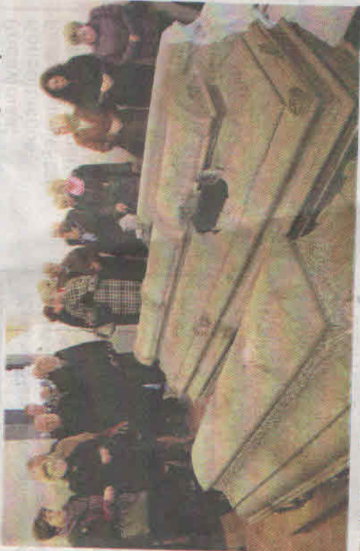
Festivalio svečiams, rėmėjams pirmiesiems suteikta galimybė atiduoti pagarbą grafams Tiškevičiams. Sarkofagai su jų palaikais rasti ir į muziejaus saugyklą pervežti festivalio išvakarėse.