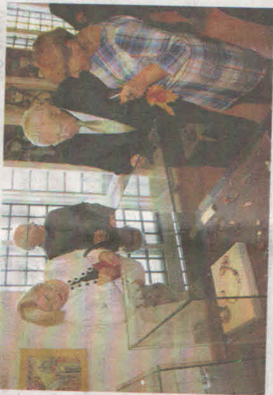
Muziejaus parodų salėse atidaryta Kretingos krašto menininkų kūrybos darbų paroda „Sielos proveržiai“.