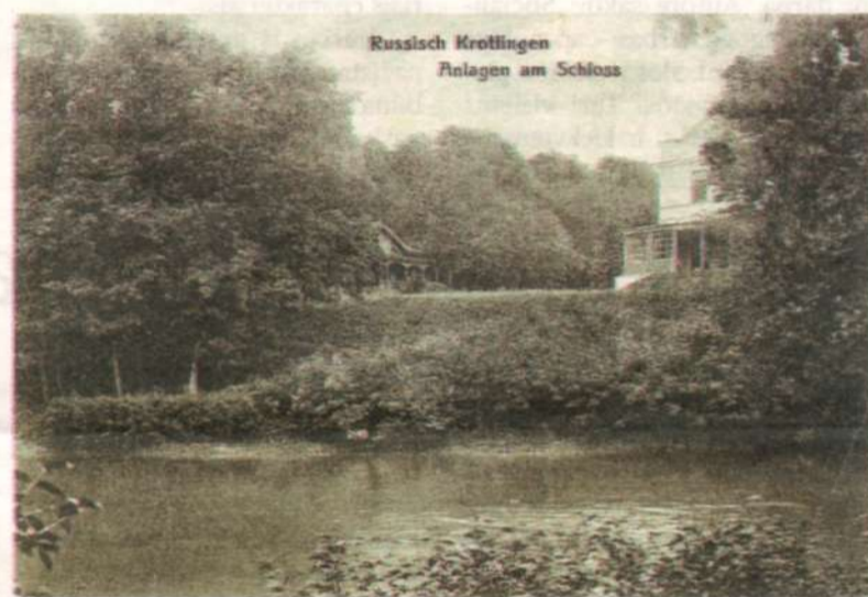
► Kretingos rūmų ir pirmojo tvenkinio vaizdas, užfiksuotas nuotraukoje apie 1915 m.

Pagal išlikusius dvaro matininko Šostako inžinerinius brėžinius par-ke buvo įrengti 5 fontanai, šeštasis – Žiemos sode. Vanduo į fontanus ir į krioklį patekdavo per natūra-