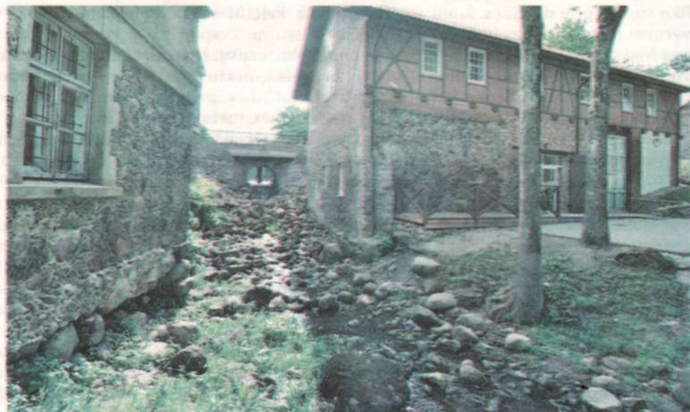
► Nors vandens malūnas (dešinėje) buvo keliskart perstatytas, bet išliko 1775 m. auten-tiškų pamatų liekanų.