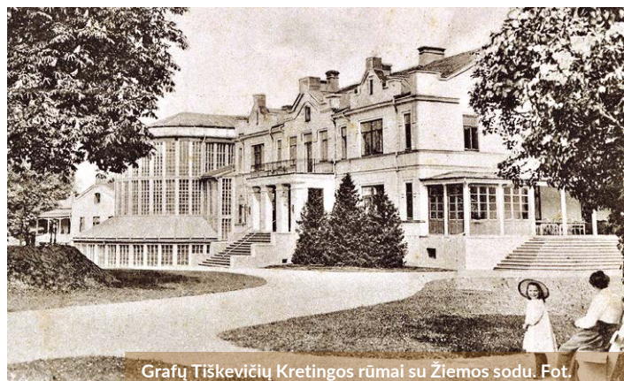
Grafų Tiškevičių Kretingos rūmai su Žiemos sodu. XX a. pr.

Visų skverų viduryje buvo įrengta po fontaną, kurių dekoratyviniai baseinai buvę skirtingų formų. Rožyno skvero baseinas buvęs ištęsto ovalo su žvaigž-diniais kampais pavidalo. Ties jo galais buvo įrengta po vandens purkštuką, o centre ant riedulių pastatyta