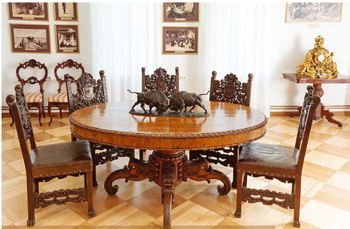
Rūmų svetainės kėdės su grafų Tiškevičių giminės herbais. XIX a. 9 deš. Kretingos muziejaus ekspozicija

bronzinė skulptūra, vaizduojanti stovintį gnomą (nykštuką), rankomis plėšiantį uolieną, iš kurios į viršų tryško vandens čiurkšlė. Šio fontano liekanas pavyko aptikti 2006 m. Jo baseinas buvęs 16 m ilgio ir 10,5 m pločio, pailgas šiaurės ir pietų krypties, vidutinio dydžio ir smulkiais akmenimis išgrįstu dugnu, sienelės – raudono molio plytų mūro, tinkuotos su kalkėmis maišytu tinku. Ties šiauriniu galu buvusi mūrinė kvadratinio plano šachta vandentiekio sklendei 32 .