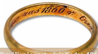
Sofijos Tiškevičienės vestuvinis žiedas. 1860 m. Kretingos muziejus (IB-38)

Juozapas buvo ryžtingas ir stiprios valios žmogus, kuris siekdamas savo tikslų sugebėdavo įveikti visas