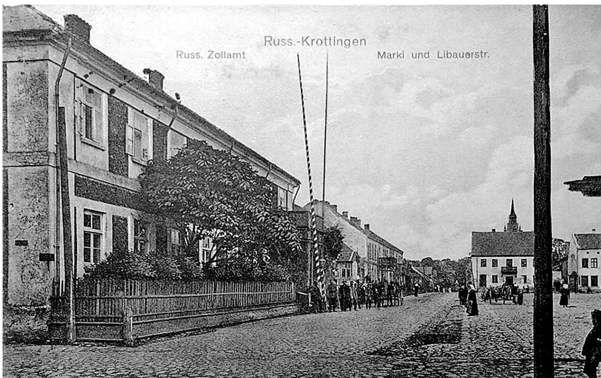
► 1915 m. vokiškas atvirukas: 1842 m. dab. „Senukų“ vietoje stovėjusį pastatą iš dvaro išsinuomojo Rusijos imperijos Vidaus reikalų ministerijos Muitinės žinyba ir jame įrengė Kretingos muitinės įstaigą. Priešais muitinės pastatą stūksojo pora aukštų flagštokų su vėliavomis. Juos ir muitinę saugojo ginkluotas sargybinis, kuriam prie įėjimo buvo pastatyta dryžuotai dažyta būdelė.