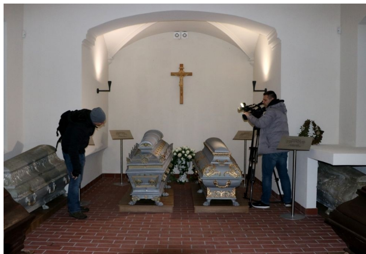
restauruotose ir į Kretinę atvežtuose sarkofaguose ilsisi grafų Juozapo ir Sofijos Tiškevičių palaikai.

Grafų sarkofagų restauravimą finansavo Kultūros paveldo departamentas (KPD), darbams buvo skirta 50 tūkst. eurų.