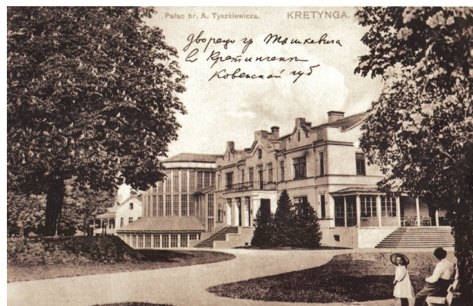
Veranda sunyko po Pirmojo pasaulinio karo ir nebebuvo atstatyta. 1900-1908 m. nuotrauka.

Nuo verandos atsiverdavo vaizdas į dvaro parką, tvenkinį su kriokliu, o vasarą ten vykdavo kamerinės muzikos koncertai.