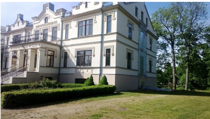
Tiškevičių dvaro rūmams trūksta paskutinio elemento - rytinėje pusėje buvusios medinės verandos.