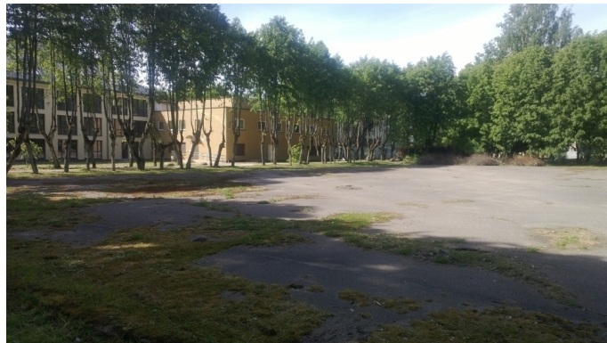
Aistros verda dėl šios asfaltuotos aikštelės.

„Pradėjome naikinti tuos sovietinius „stebuklus“ dvaro aplinkoje ir nematau prasmės keisti kryptį. Kita vertus, Kretingoje statomas visas sporto kompleksas. Dvaro parkas turi būti atkuriamas toliau“, – įsitikinęs meras.