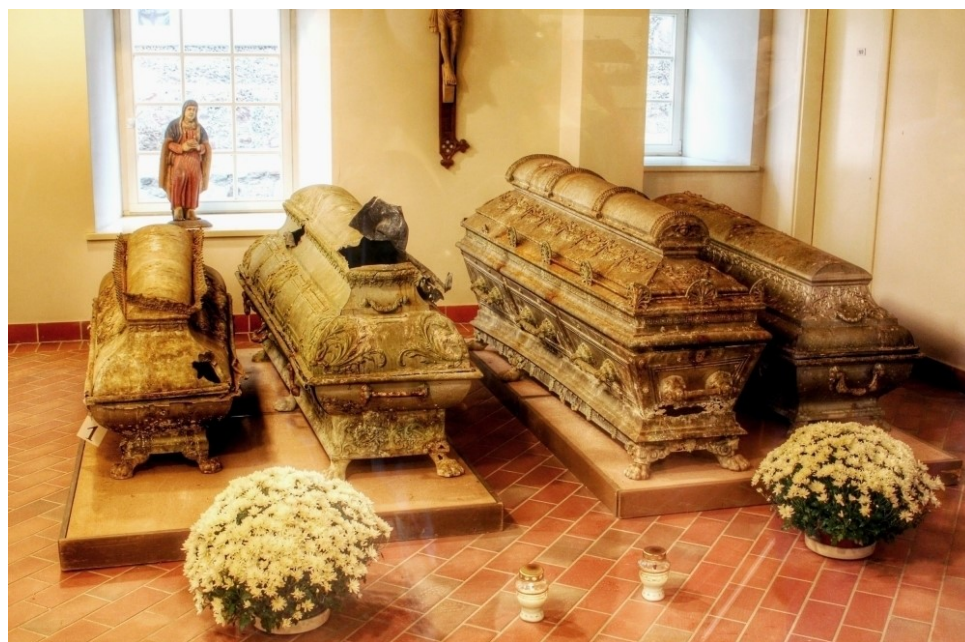
Koplyčios kriptoje aptikti sarkofagai saugomi Kretingos muziejaus senojo vandens malūno rūsyje.

Abiejų didikų sarkofagai – itin prašmatnūs, puošti įvairiausiais skirtingo metalo elementais. Šiuo metu jie saugomi Kretingos muziejuje, buvusio dvaro vandens malūno pastate.