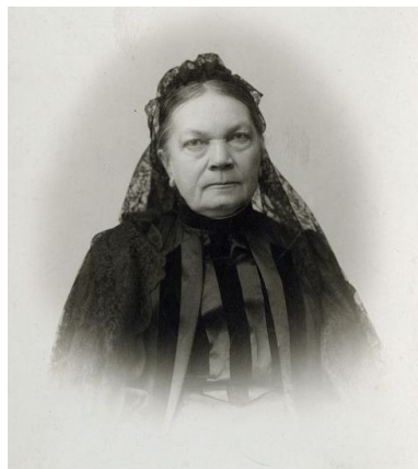
Grafai Juozapas ir Sofija Tiškevičiai.

Prieš septynerius metus čia restauruoti visi penki Kretingos bažnyčios rūsyje buvę sarkofagai: etmono Jono Karolio Chodkevičiaus ir jo žmonos Sofijos, judviejų dukros ir dviejų sūnų. Dar viename ilsisi šimtmečiu vėliau palaidoto, bet su Chodkevičių šeima nesusijusio, vaiko palaikai. Pirmiausia restauruotas trečios Chodkevičių atžalos sarkofagas – Jonas Kazimieras gimė 1605 metais ir gyveno vos keturias valandas. Iš alavo išlietas, graviruotas renesanso stiliaus sarkofagas saugomas bažnyčios rūsyje nuo 1607 metų. Jį restauruojant pašalinti geometriniai iškrypimai, retušuoti dangčio tekstai ir piešinys, jo paviršiui gražinta seno alavo spalva. Paskutinis į kriptą grįžo S. Mieleckaitės–Chodkevičienės sarkofagas – bene gražiausias ir didingiausias iš visų penkių. Vien jam restauruoti prireikė dvejų metų.