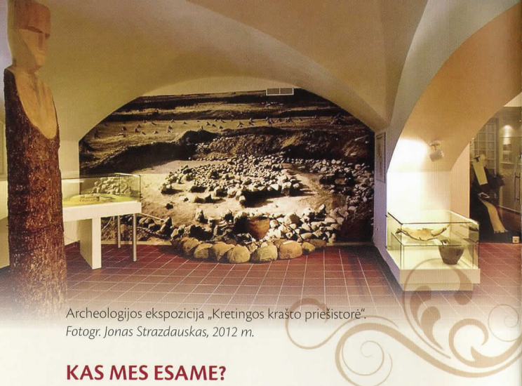
Archeologijos ekspozicija „Kretingos krašto priešistorė“. Fotogr. Jonas Strazdauskas, 2012 m.