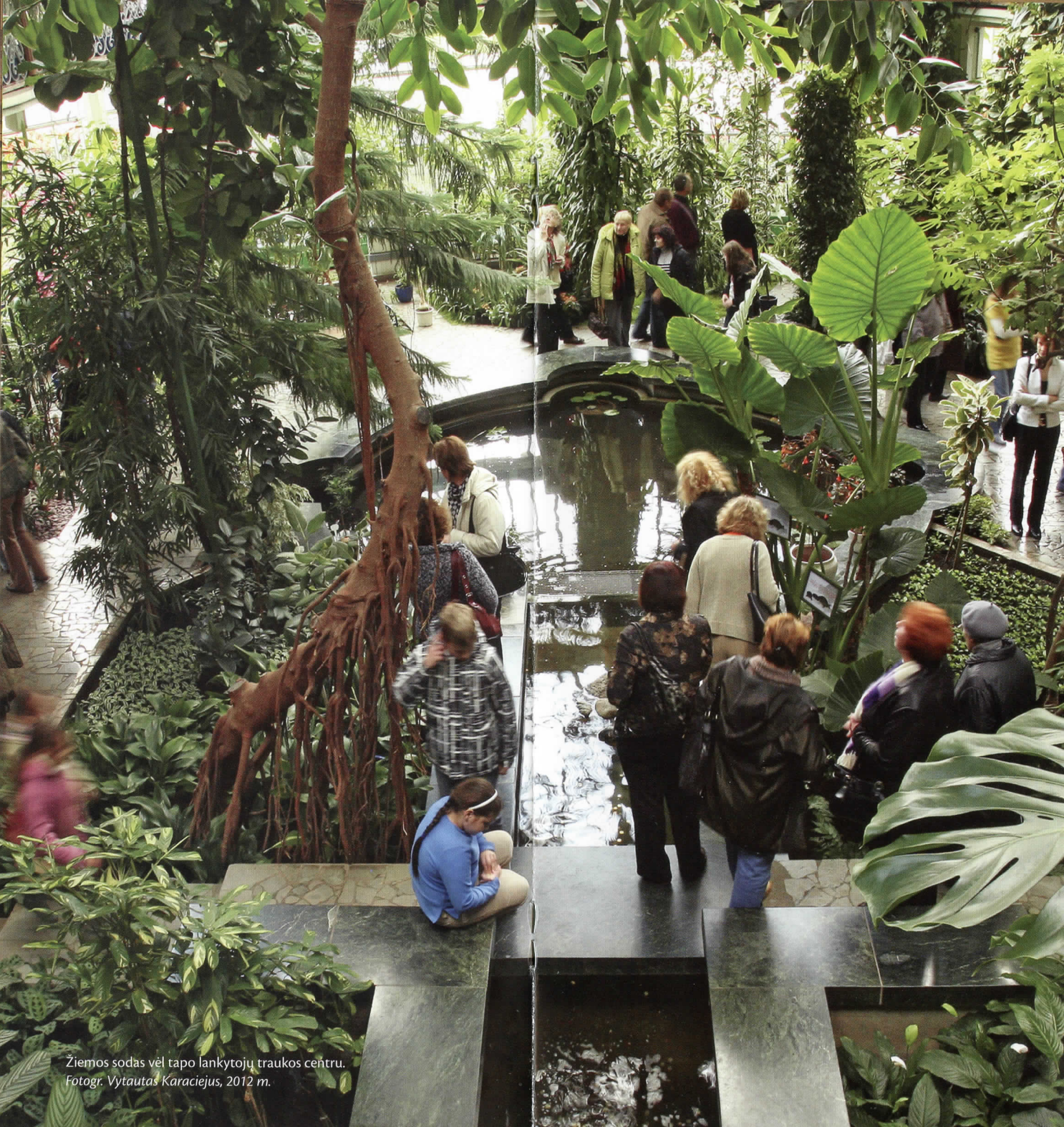
Žiemos sodas vėl tapo lankytojų traukos centru. Fotogr. Vytautas Karaciejus, 2012 m.