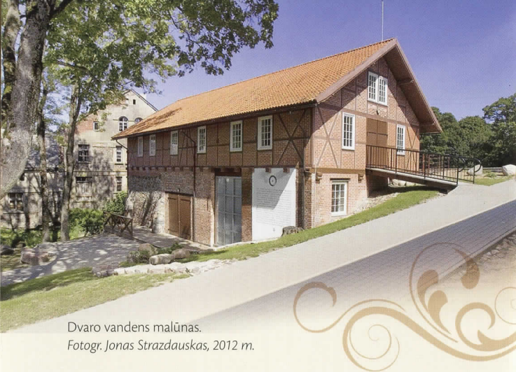
Dvaro vandens malūnas. Fotogr. Jonas Strazdauskas, 2012 m.

Žiemos sode atnaujinta botanikos ekspozicija „Nuo kaktusų kolekcijos iki bugenvilijos žiedų“. Lankytojams pristatomos retos augalų kolekcijos.