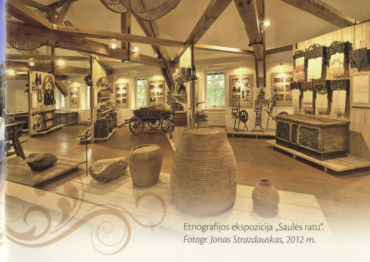
Etnografijos ekspozicija „Saulės ratu“. 2012 m.