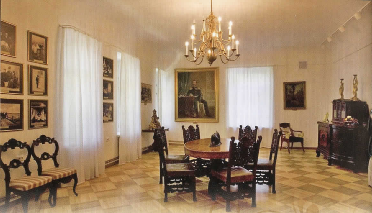
Dvaro istorijos ir kultūros ekspozicija. Fotogr. Jonas Strazdauskas, 2012 m.

baltų amatininkų – juvelyrų – papuošalų komplektai, atskiri unikalūs ažūriniai dirbiniai: segės ir vėriniai su raudono emalio dekoru, žalvarinės segės bei smeigtukai, dengti sidabro imitacija – alavo danga. Pateikti vėriniai iš tekintų gintaro karolių ir subtilių kabučių liudija gintaro, kaip amuleto, svarbą. Eksponuojami ir kuršių diduomenės papuošalų komplektai. Jie išsiskiria dydžiu, iš brangiojo metalo kalstytomis apkalomis, pagaminti iš sidabro lydinių, o išskirtiniais atvejais – dekoruoti auksu. Moterų papuošaluose atsispindi saulės, pasaulio medžio simbolika. Vyrų papuošaluose dominuoja zoomorfinis stilius. Aktyvius mainus liudija sudedamos svarstyklės, svareliai.