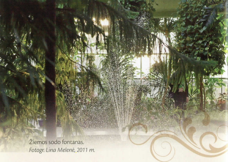
Žiemos sodo fontanas. Fotogr. Lina Melenė, 2011 m.