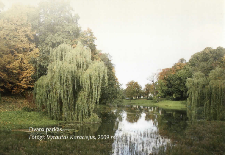
Dvaro parkas.

Kviečiame susipažinti su turiningomis naujomis ekspozicijomis, pasivaikščioti istoriniame parke, dalyvauti mūsų rengiamose parodose, konferencijose, edukaciniuose užsiėmimuose, koncertuose, Kretingos dvaro šventėse, pailsėti kavinėje „Pas grafą“ ir tarp žaliuojančių bei žydinčių augalų išgerti puodelį kavos.