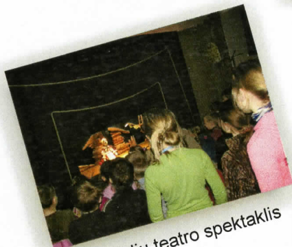
Vaikų lėlių teatro spektaklis "Ožio balsas"