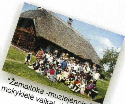
"Žemaitoka - muziejėnoka" mokyklėlė vaikai ekskursijoje