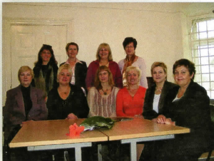
Muziejaus edukacinės klasės atidarymas