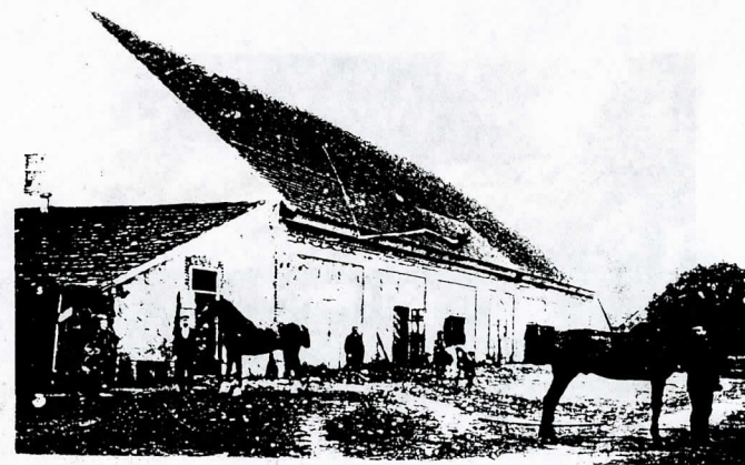
Jokūbavo dvaro sandėlis-tvartai XX a.pr.(XVIIIa.)