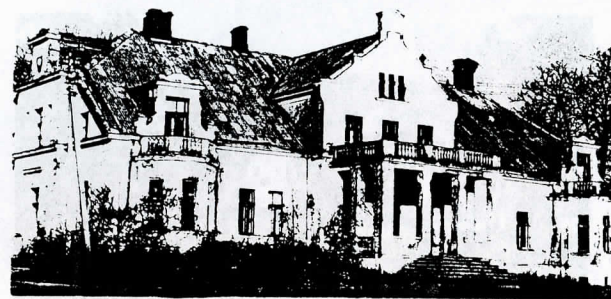
Laukžemės dvaro rūmai (1902 m.)