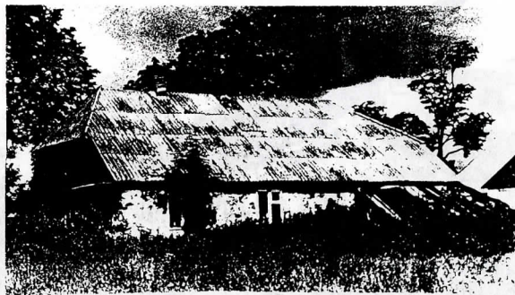
Tintelių palivarko kumetynas (XIX a.)