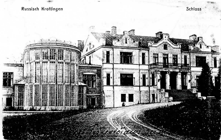
Kretingos dvaro rūmai (XIX a.vid; rekonstr. apie 1880 ir 1912 m.)