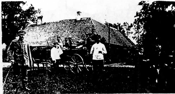
Kartenos (Sendvario) dvaro rūmai 1916 m.