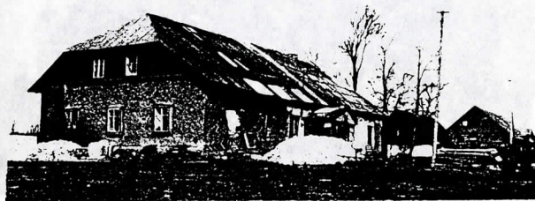
Gaudučių palivarko rūmai (XIX a.)