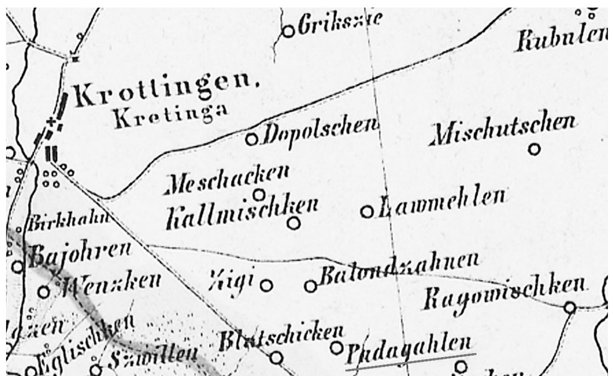
Padegaliai (Padagahlen) 1849 metais išleistame Prūsų Lietuvos žemėlapyje.

Julius KANARSKAS Istorikas, Kretingos muziejus