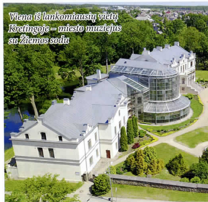
Viena iš lankomiausių vietų Kretingoje – miesto muziejus su Žiemos sodu