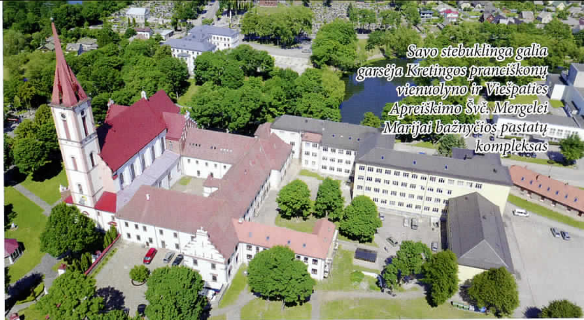
Savo stebuklinga galia garsėja Kretingos pranciškonų vienuolyno ir Viešpaties Apreiškimo Švč. Mergelei Marijai bažnyčios pastatų kompleksas

Kretingos rajone yra ir kelias puikių vietų, kur galima stiprinti savo sveikatą, pramo-