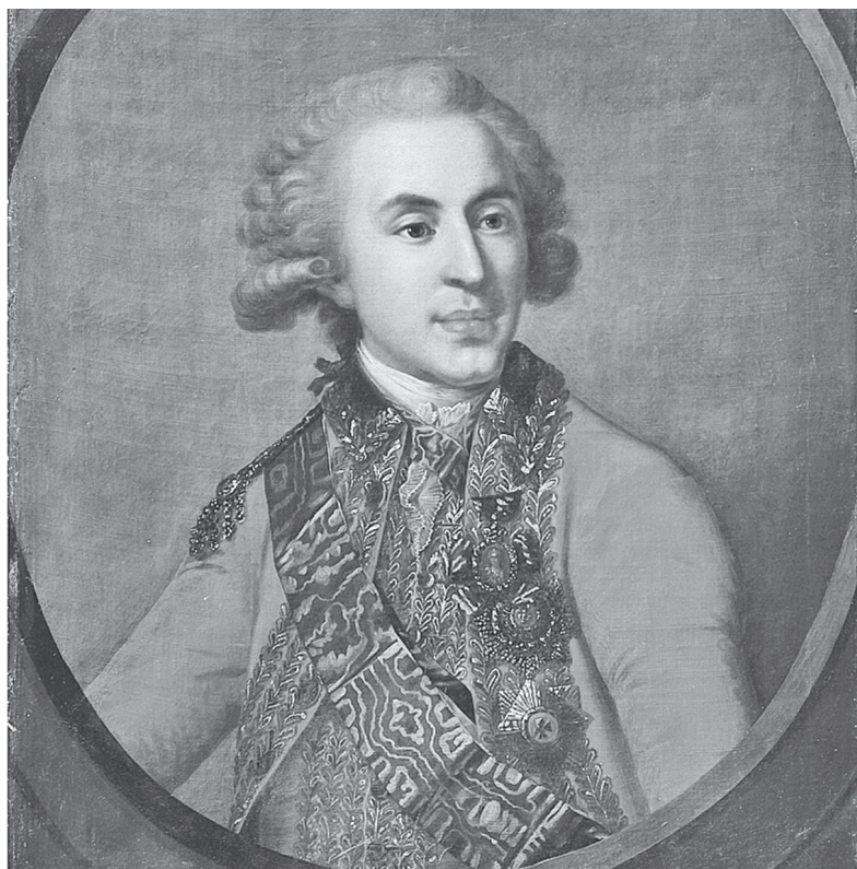
Platono Zubovo (1767–1822) portretas buvęs Kretingos vienuolyne. Dail. Johann Baptist Lampi, XVIII a. II pab. – XIX a. 3 deš. Portretas saugomas Nacionaliniame M. K. Čiurlionio muziejuje (ČDM Mt-1529).

1906 m. Konstantinas Gukovskis ir 1913 m. Stanislovas Karvovskis rašė, kad vienuolyno biblioteko-